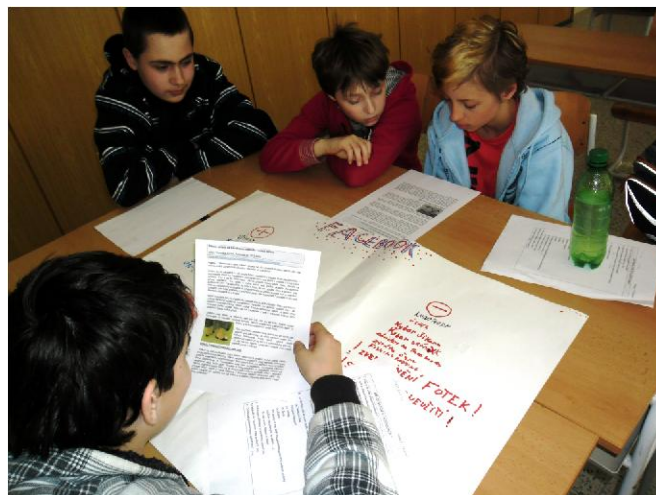
Práce s texty, žáci ZŠ Plumlov