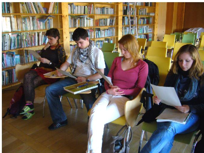
Práce s texty, studenti oboru MRS, UP Olomouc