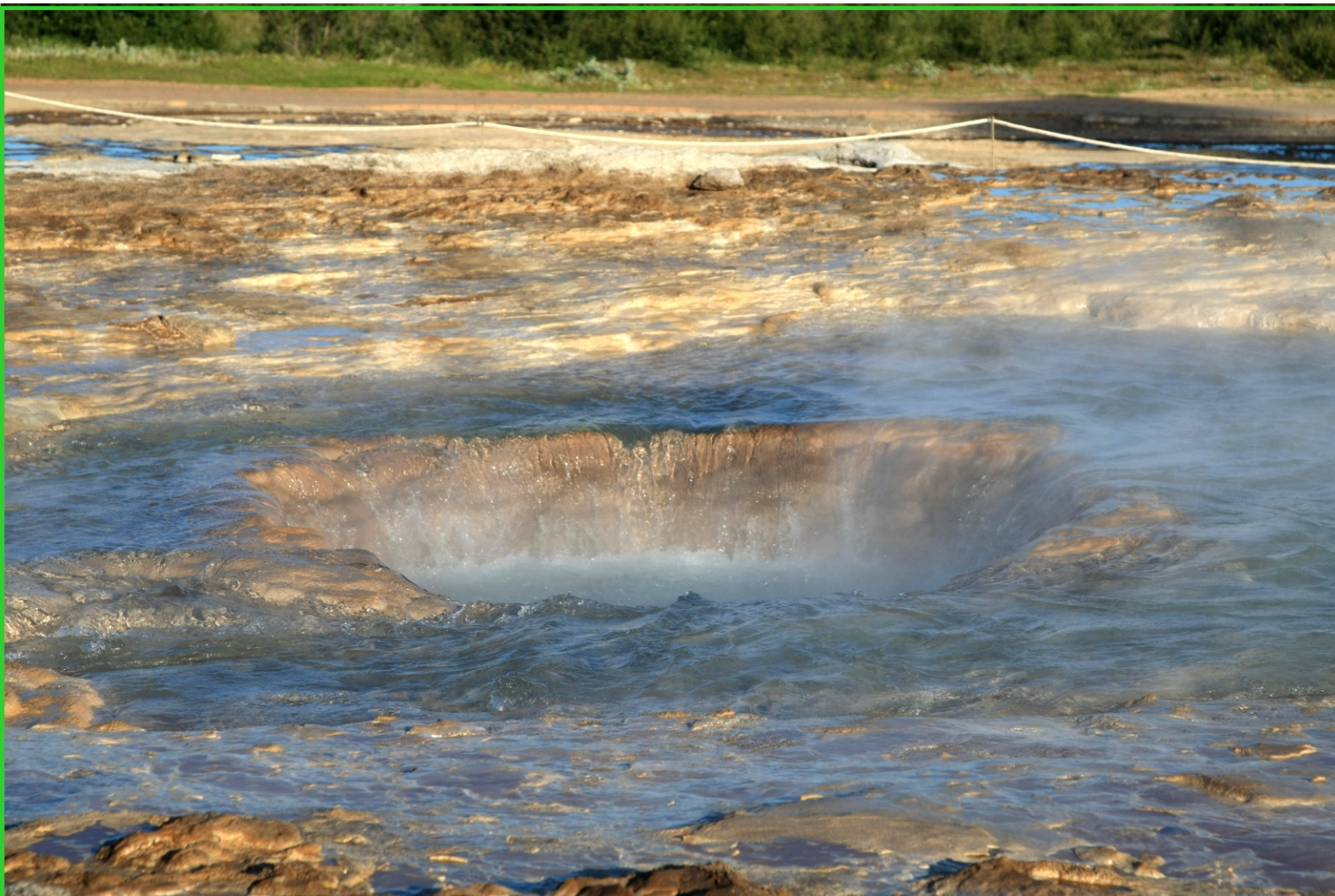
Island. Gejzír mizí pod zemí.