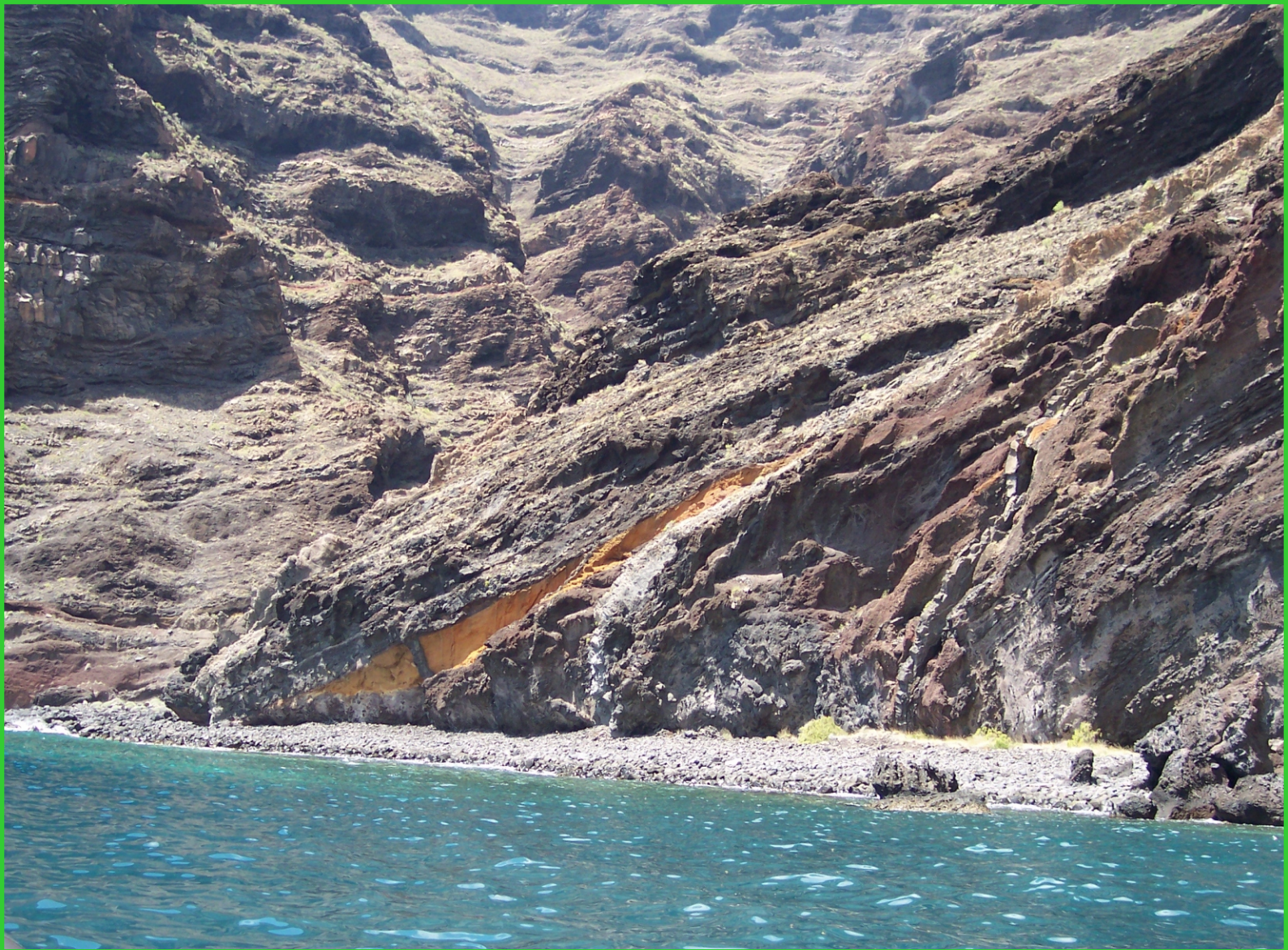
Kanárské ostrovy. Tenerife z moře.