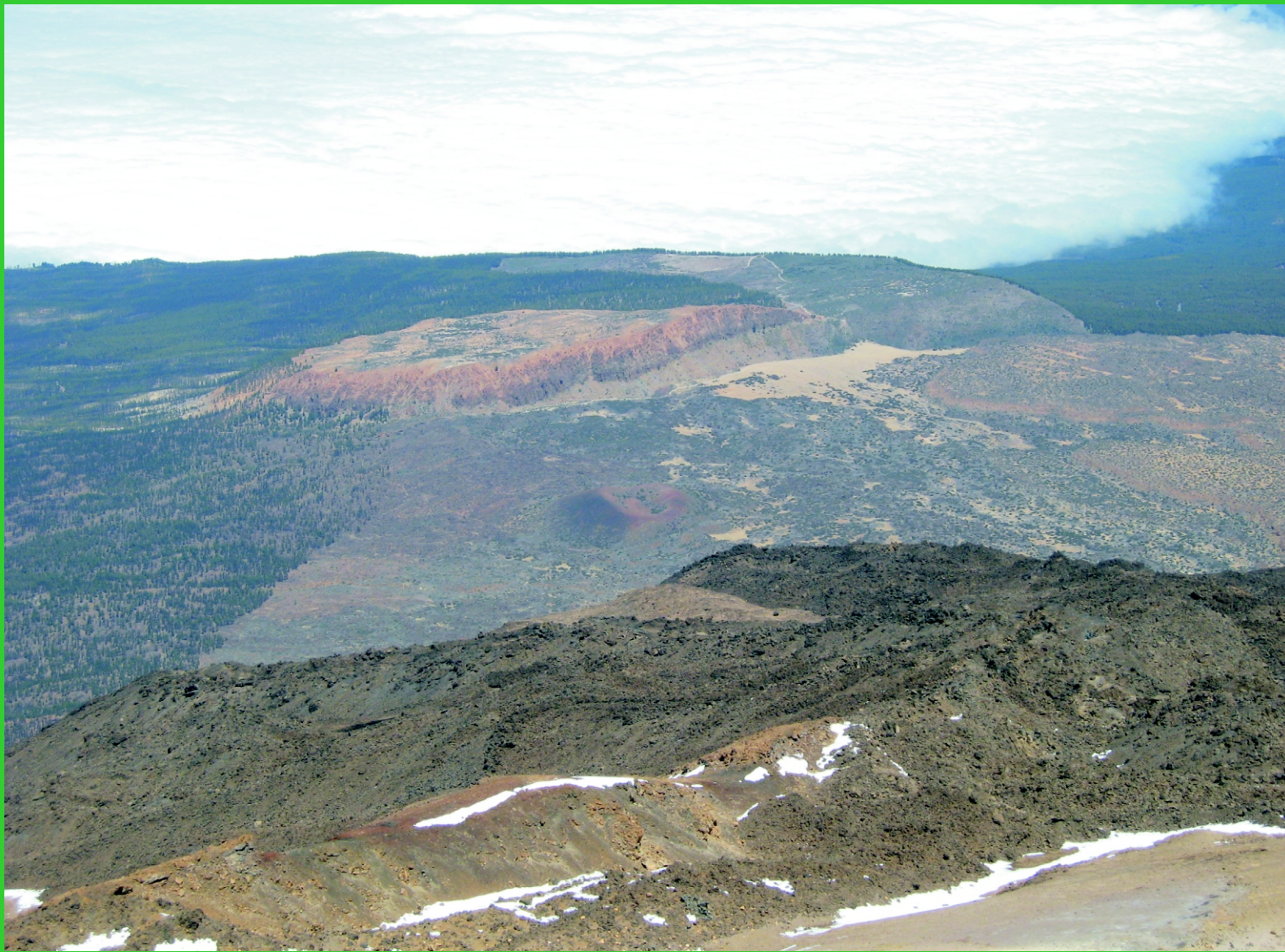
Kanárské ostrovy. Tenerife, boční kráter sopky.