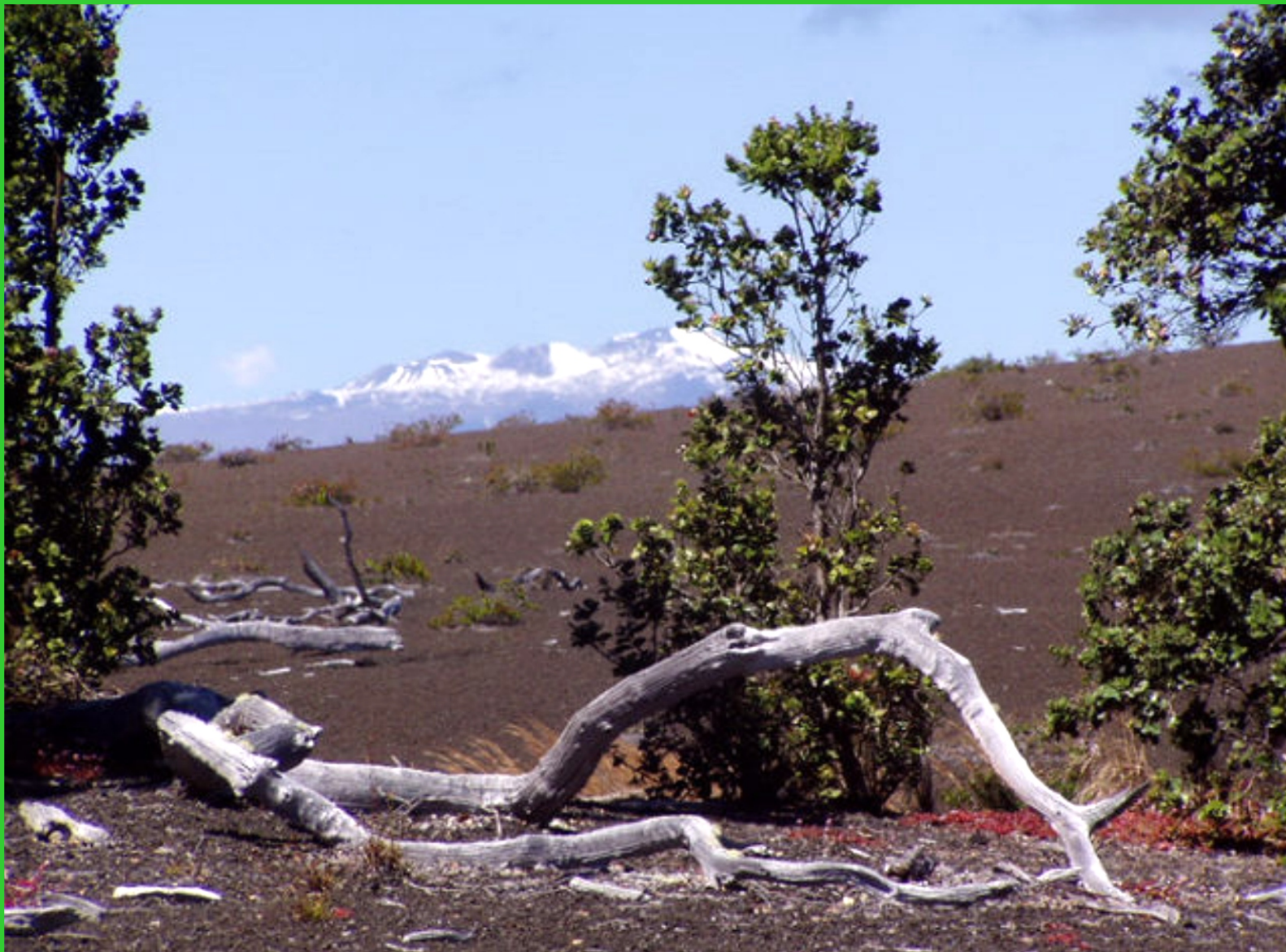
Havajské ostrovy. Big Island, sopečná pole, v pozadí Mauna Kea.