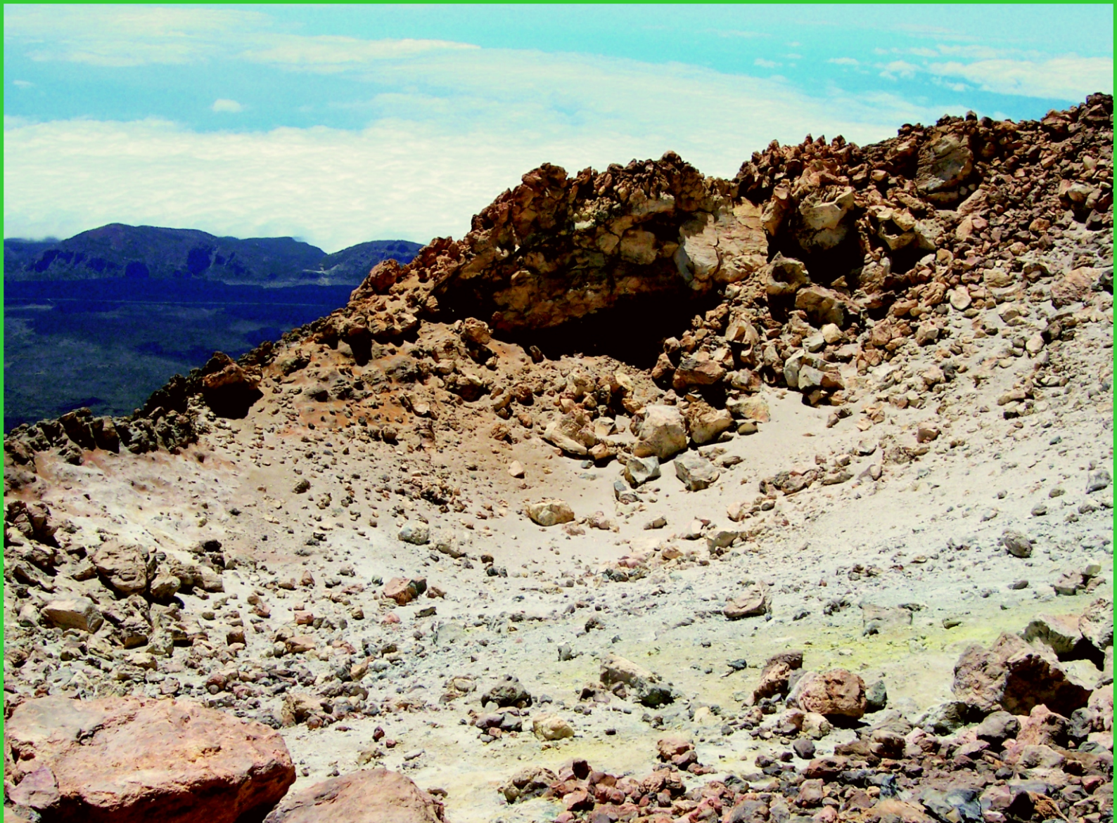
Kanárské ostrovy. Tenerife, žlutá síra v kráteru sopky.