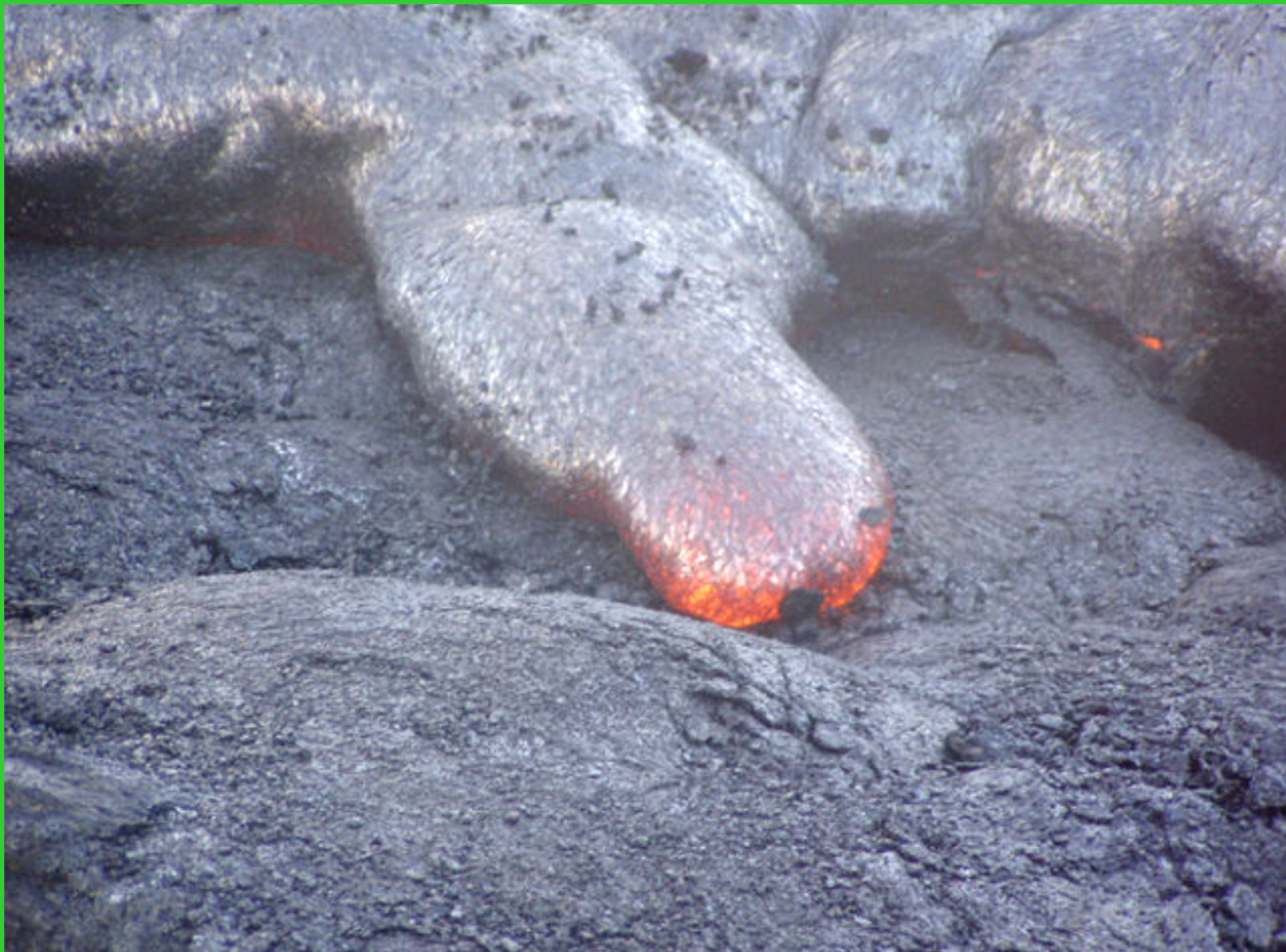
Havajské ostrovy. Big Island, tekoucí láva.