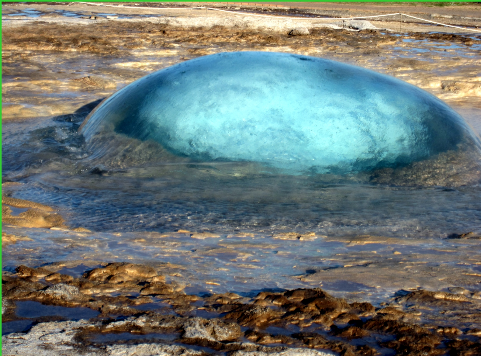
Island. Gejzír před vytrysknutím.