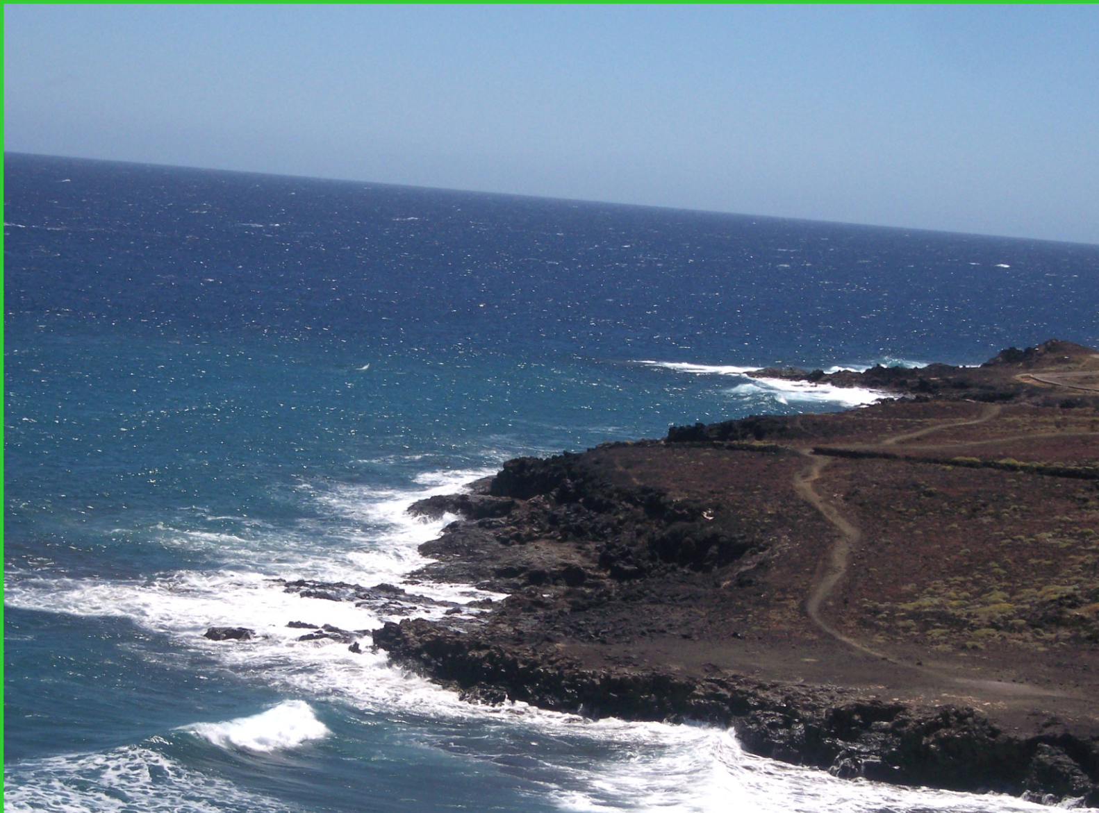
Kanárské ostrovy. Tenerife, pobřeží.