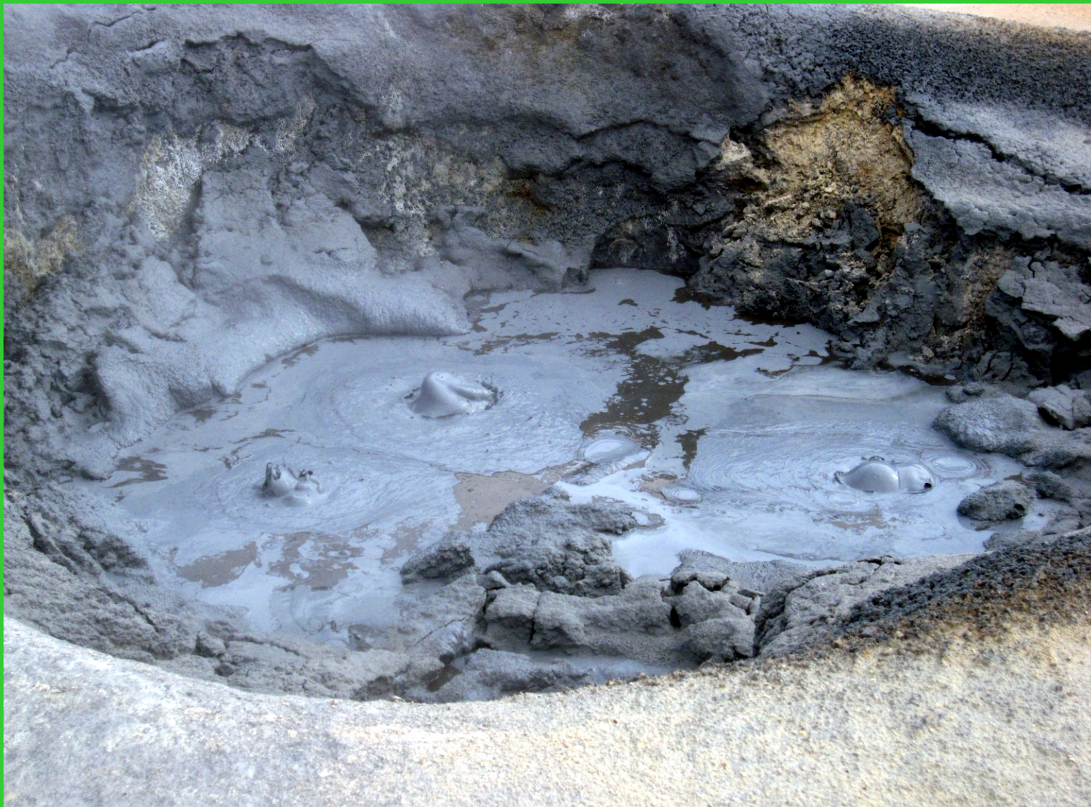
Island. Ďáblova kuchyně kousek od Kraflý. Vývěry bahna ze země.