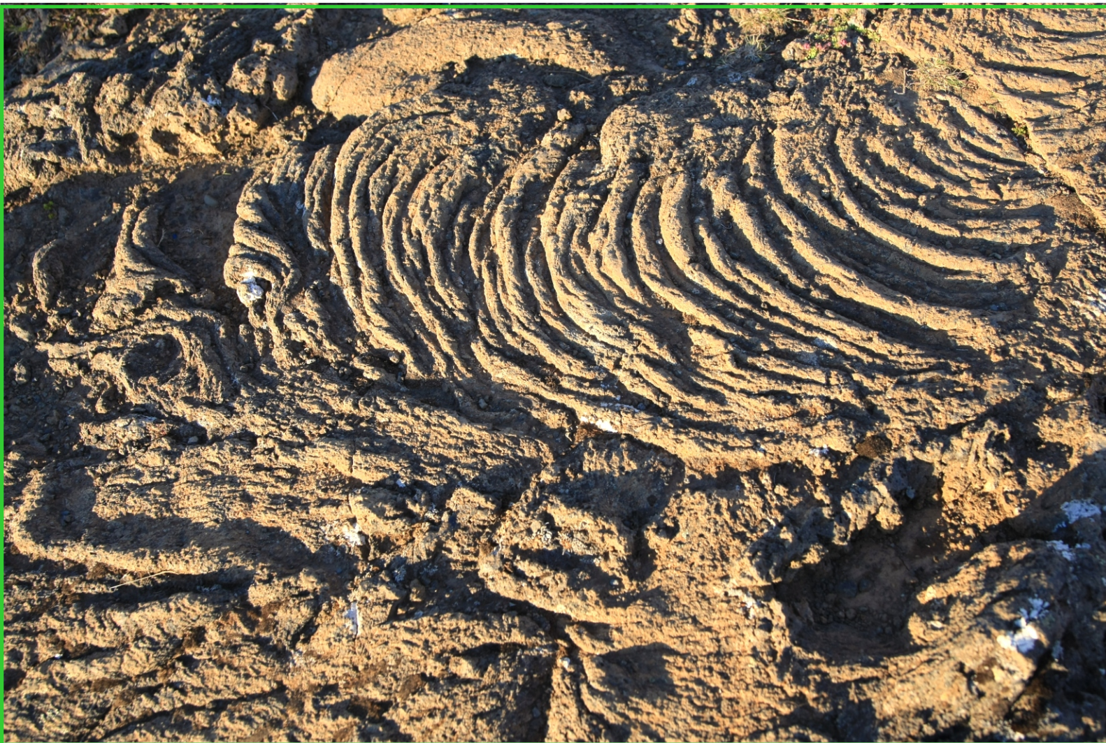
Island. Láva v mnoha tvarech.