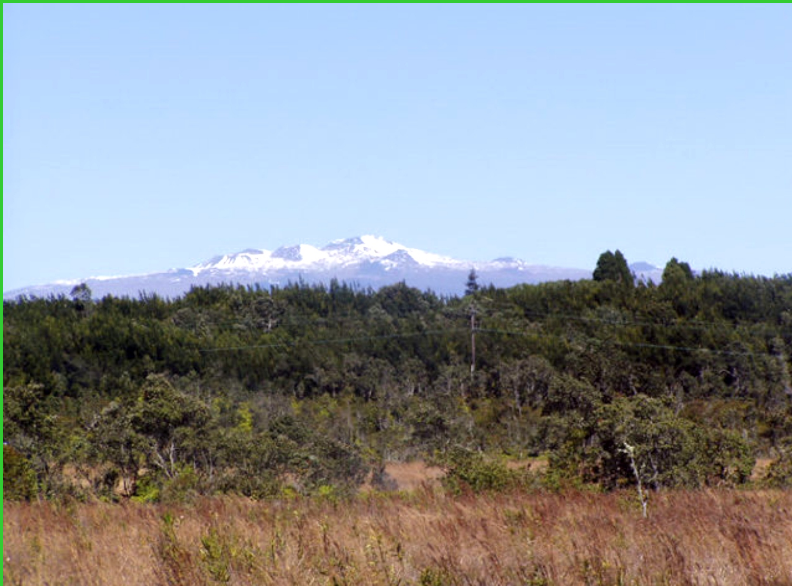
Havajské ostrovy. Big Island, Mauna Kea pod sněhem.