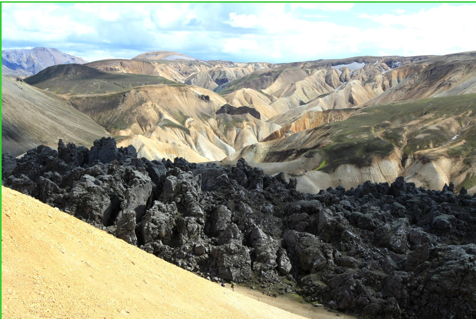
Island. Duhové hory - nová láva.