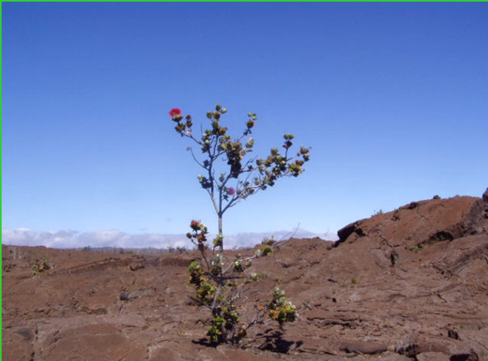
Havajské ostrovy. Big Island, první průkopnické rostliny.