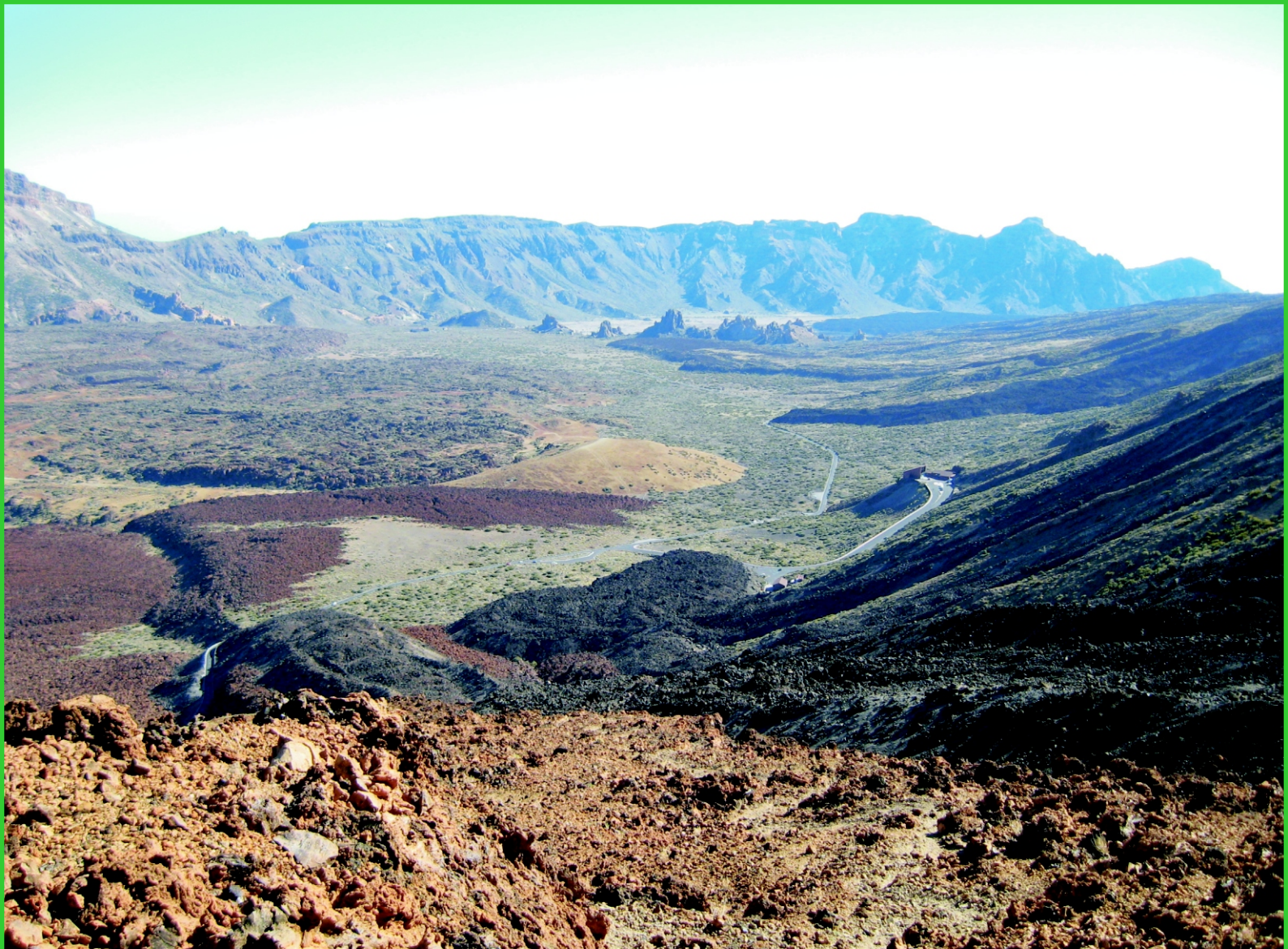
Kanárské ostrovy. Tenerife, lávové jazyky.