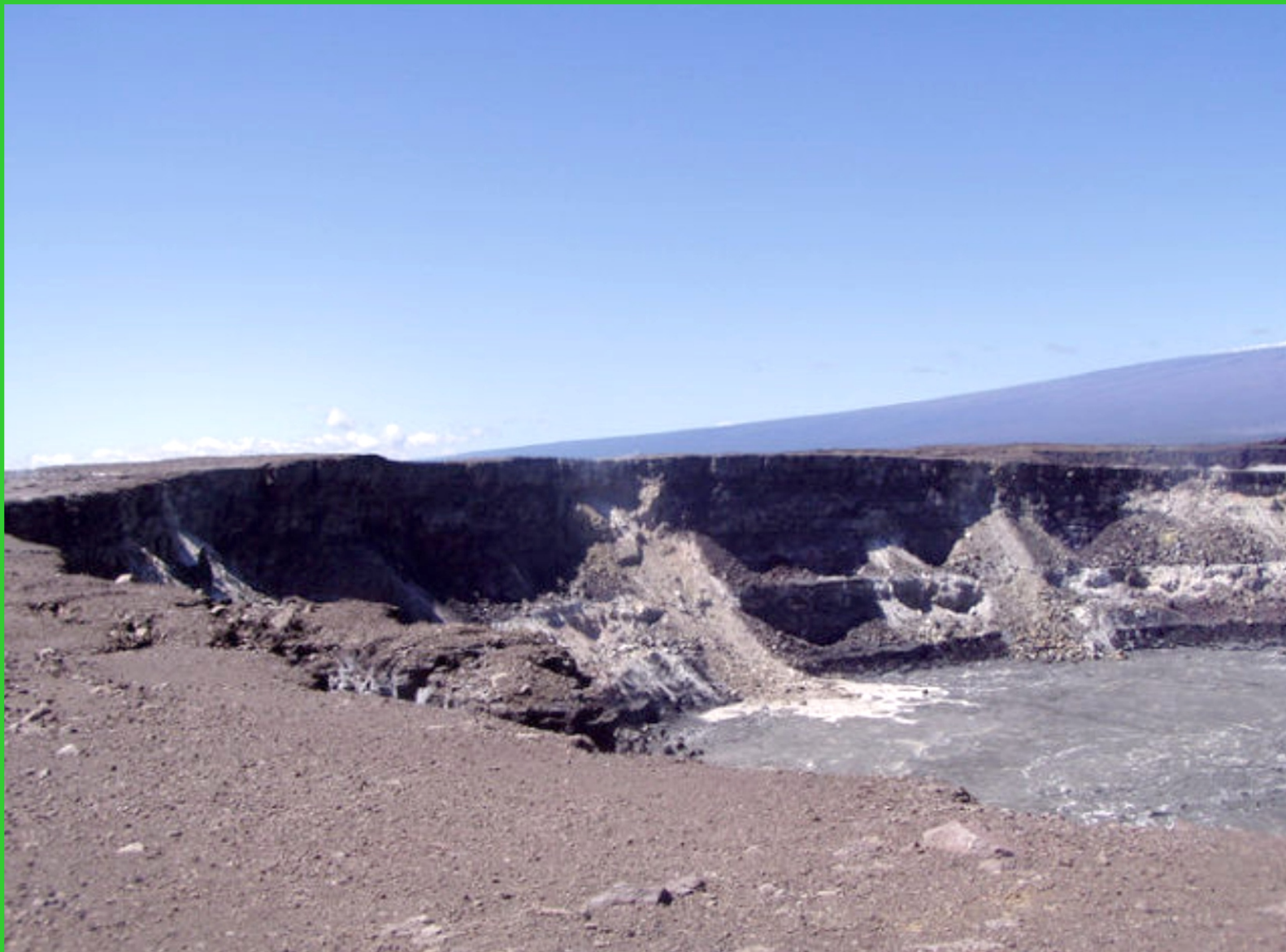
Havajské ostrovy. Big Island, kráter sopky.