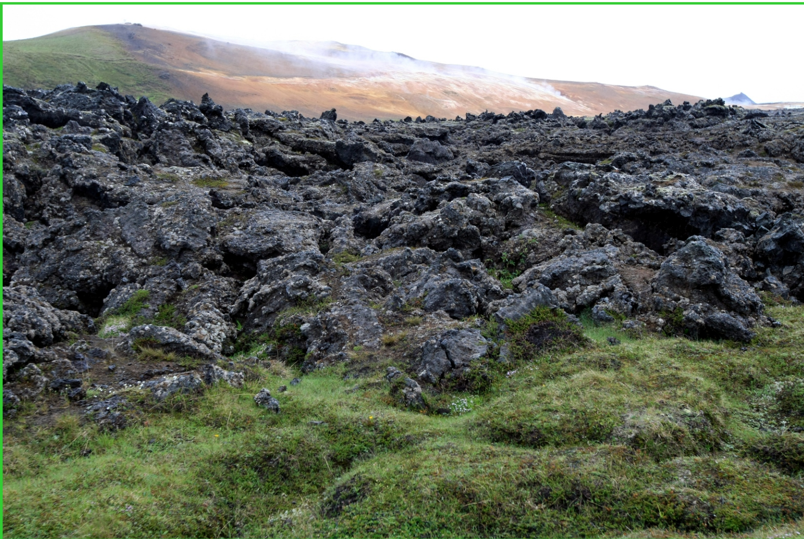
Island. Láva pod Kraflou.