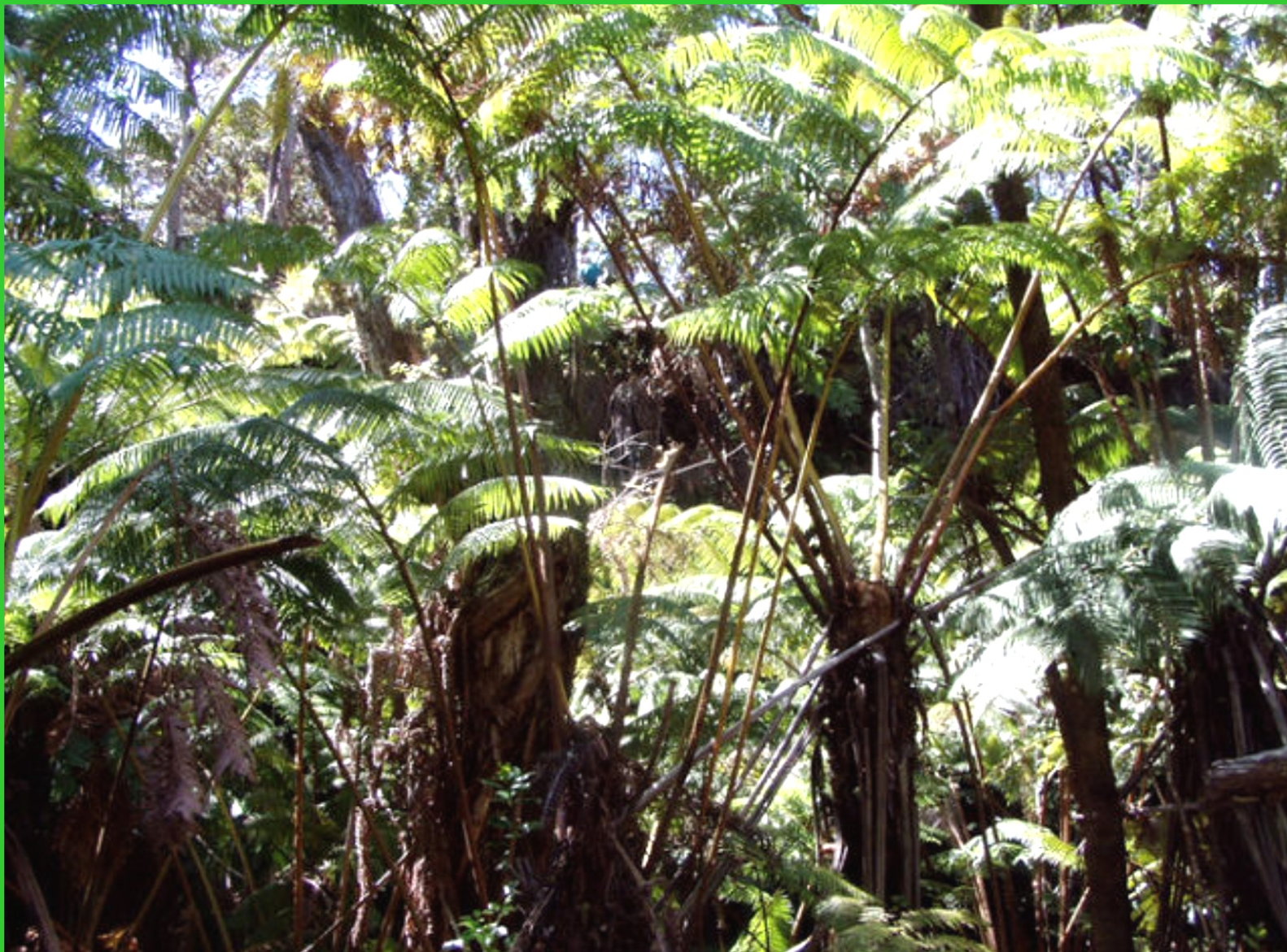
Havajské ostrovy. Big Island, kapradiny obří velikosti.