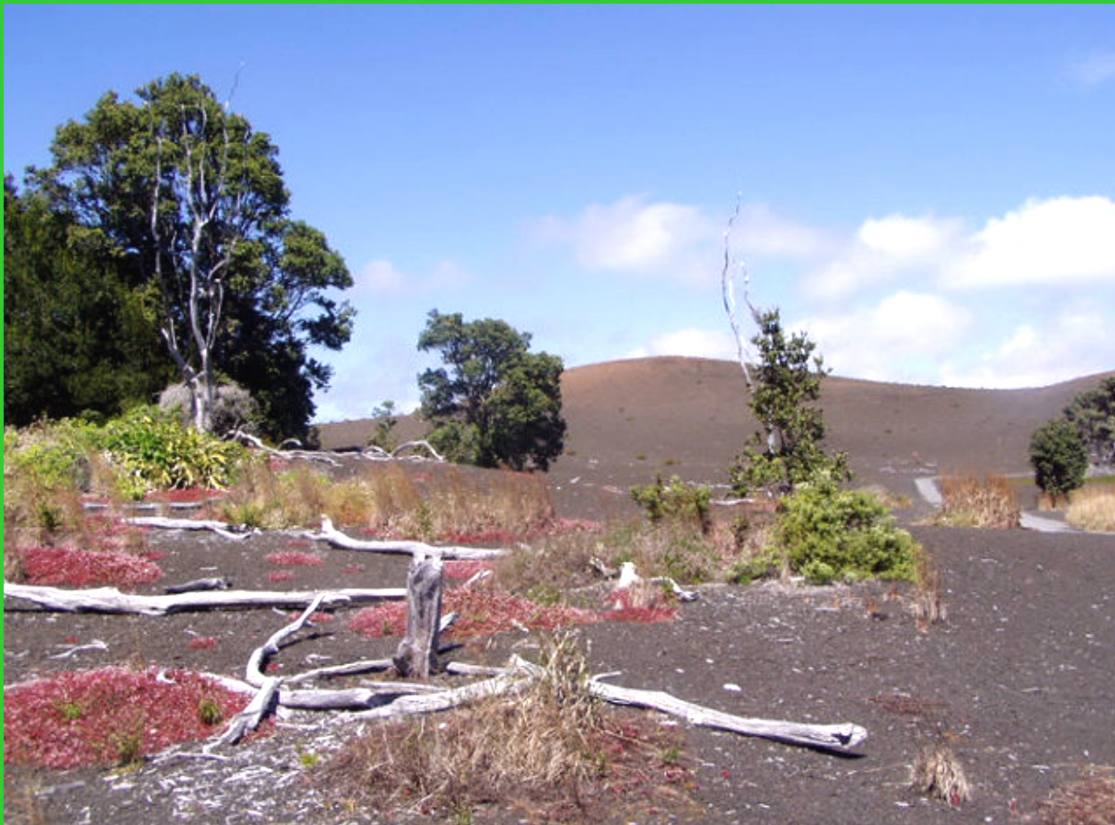
Havajské ostrovy. Big Island, cesta lávy, která znovu postupně zarůstá.