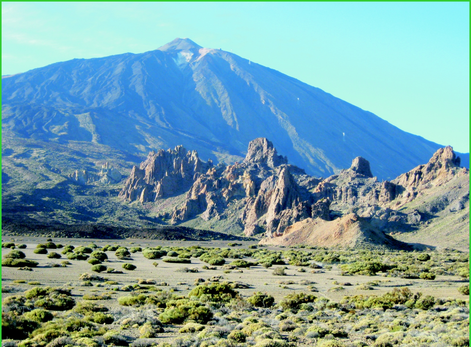
Kanárské ostrovy. Tenerife, sopka Pico del Teide.