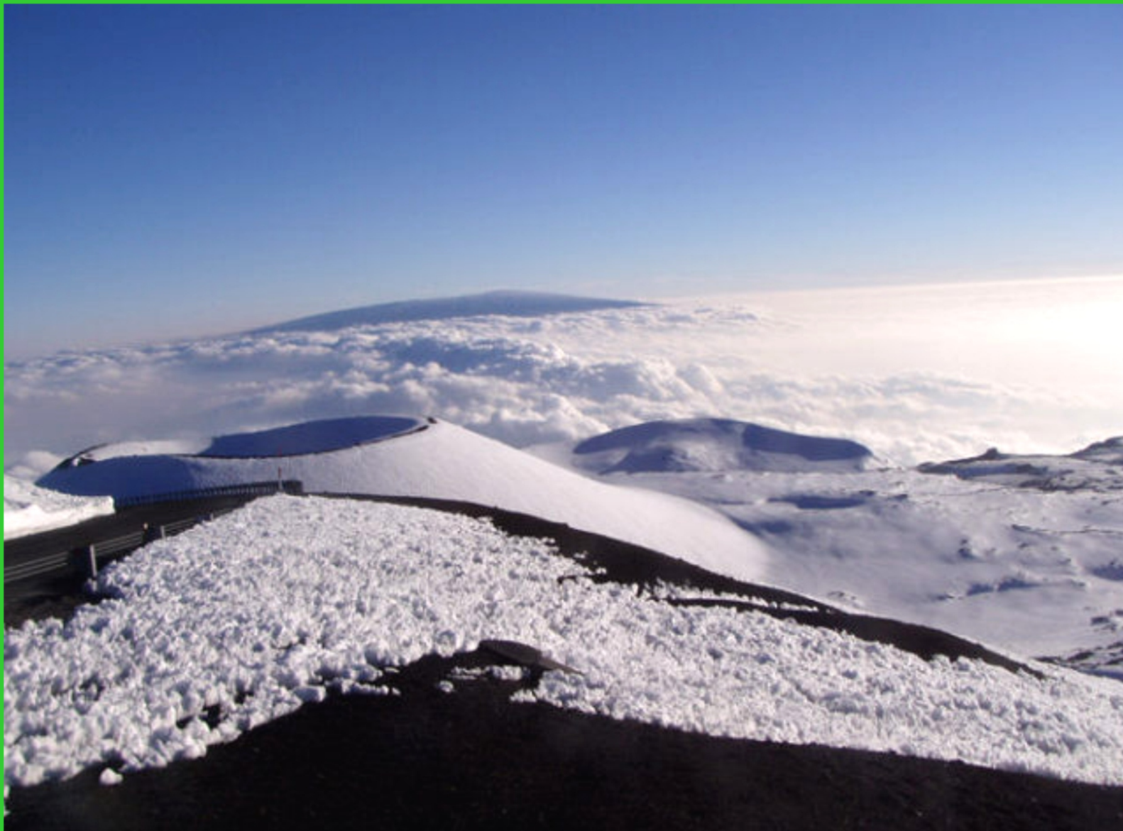
Havajské ostrovy. Big Island, pohled z vrcholu Mauna Kea 4000m.