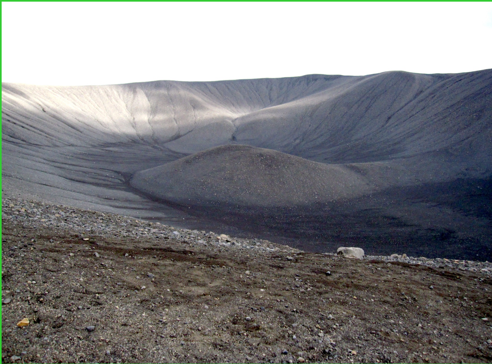
Island. Kráter sopky Hverfell (Hverfjal).