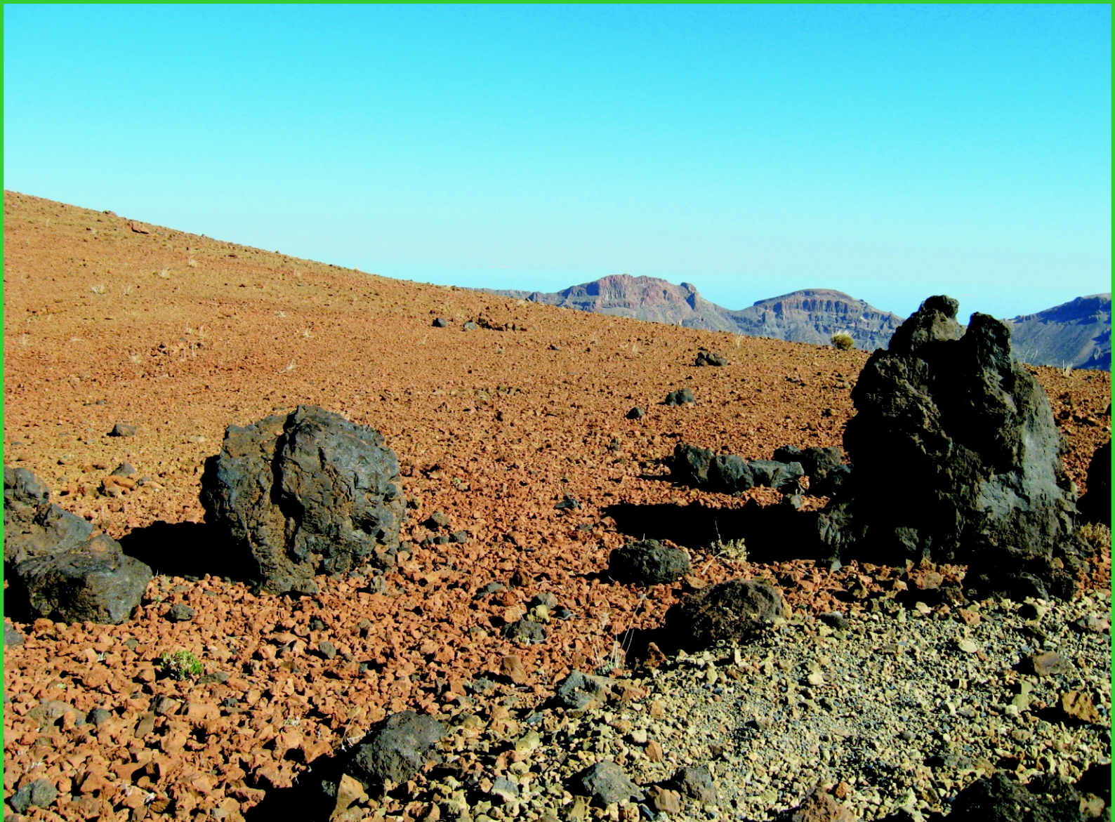
Kanárské ostrovy. Tenerife, balvany vyvržené při erupci.