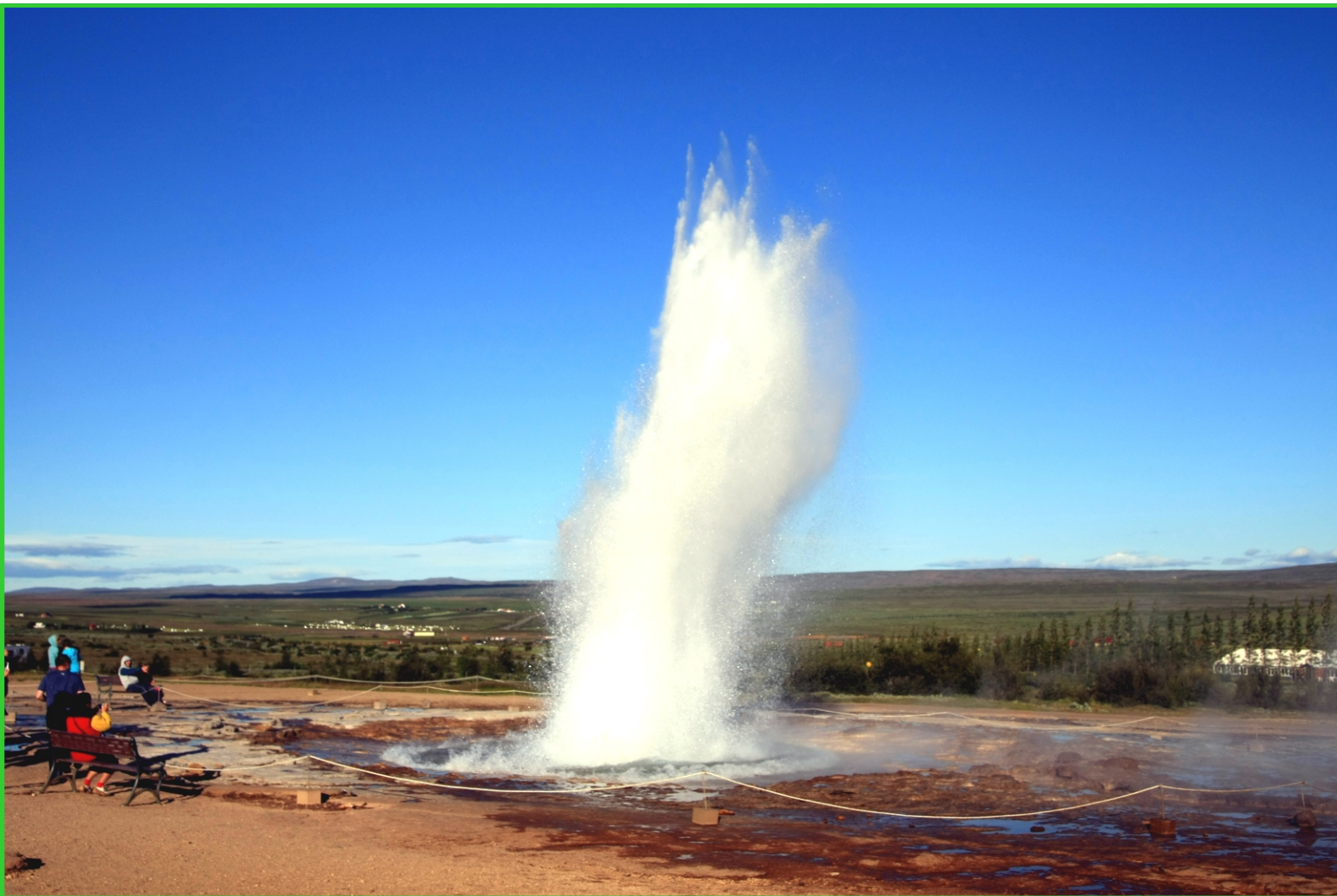
Island. Gejzír vytryskl.