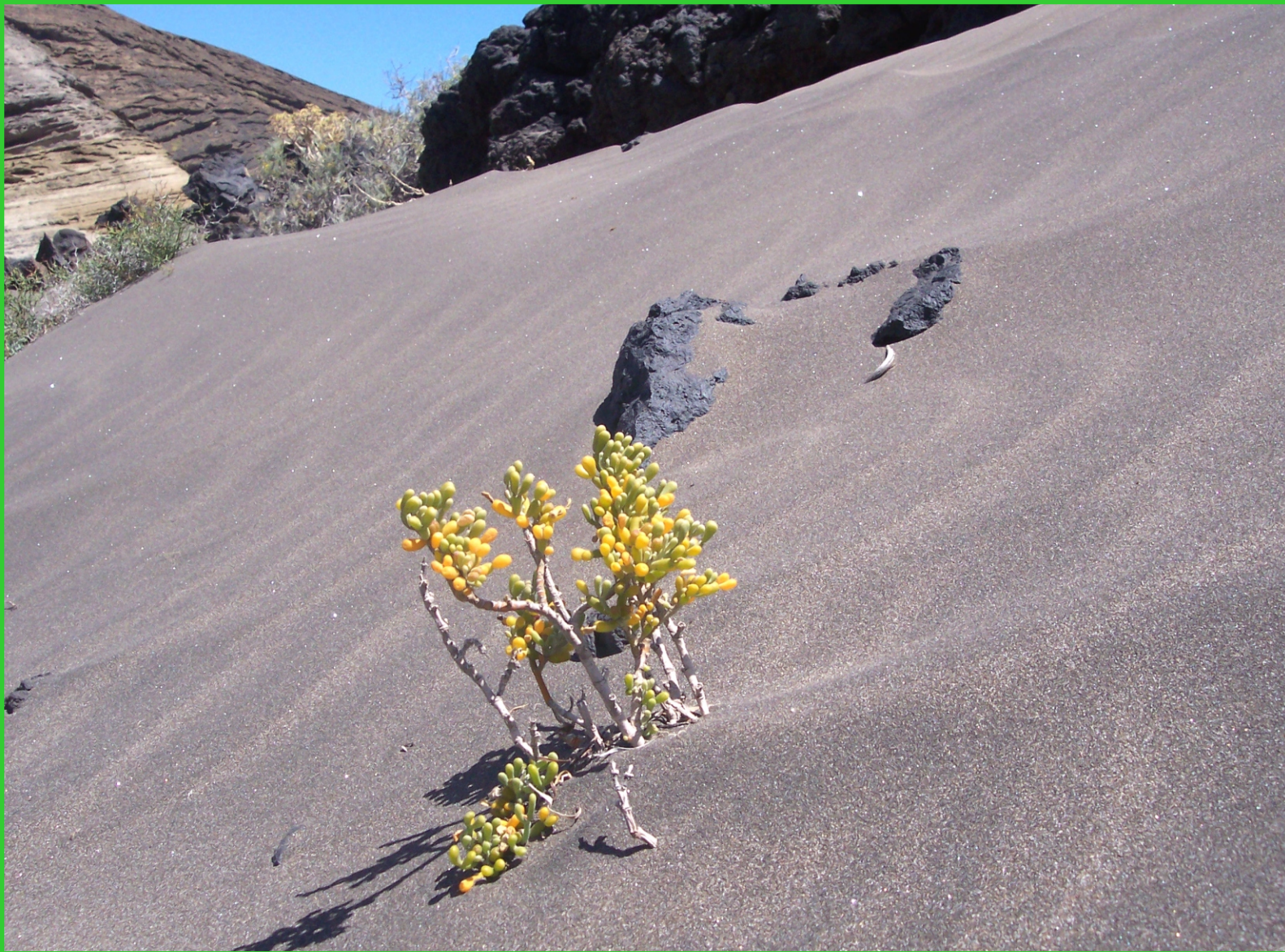
Kanárské ostrovy. Tenerife, sopečný písek.