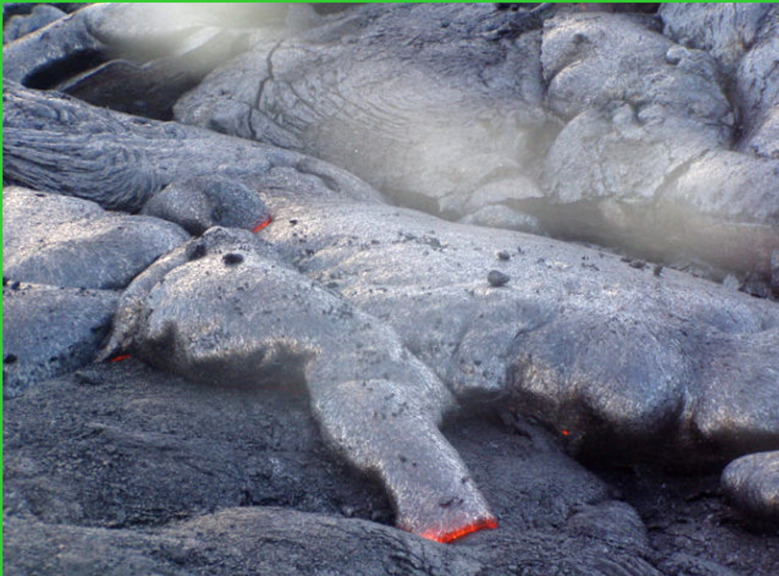
Havajské ostrovy. Big Island, tekoucí láva.