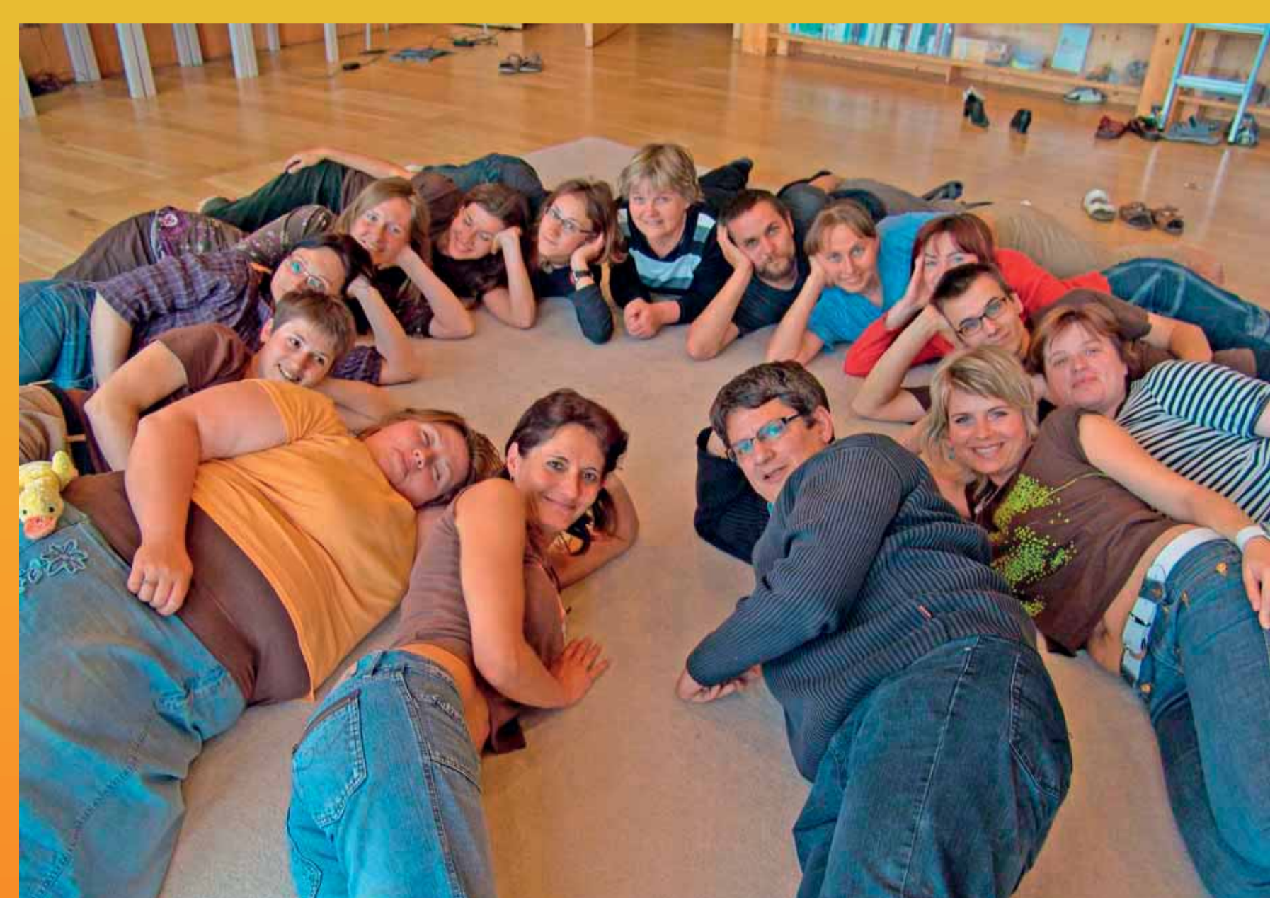
Pracovní tým Sluňákova – centra ekologických aktivit města Olomouce v Horce nad Moravou, který se podílí na tvorbě metodických materiálů.