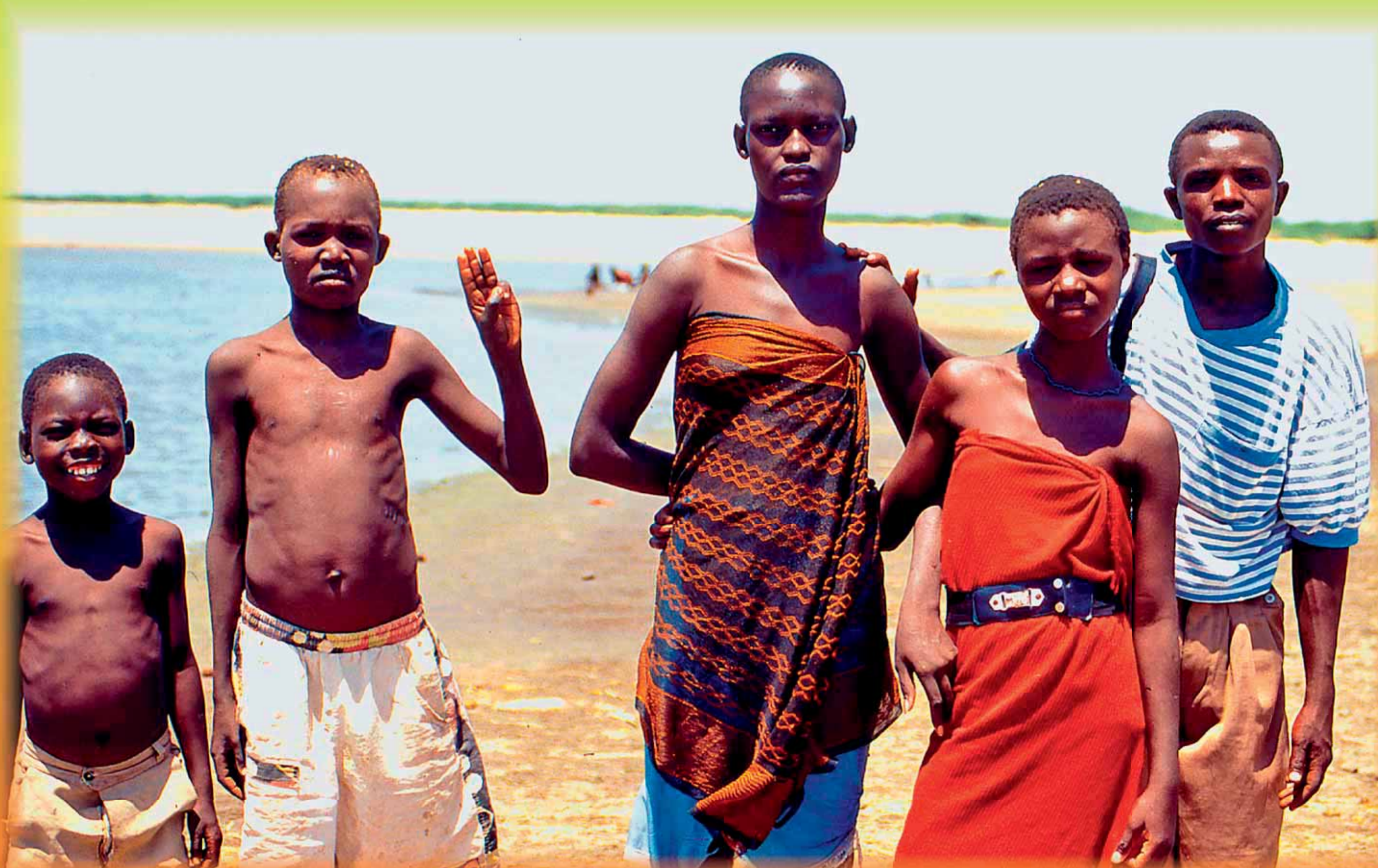
Středoškolaři z osady Kalekol, která se nachází nedaleko jezera Turkana (dříve Rudolfovo jezero). (Keňa, jezero Turkana)