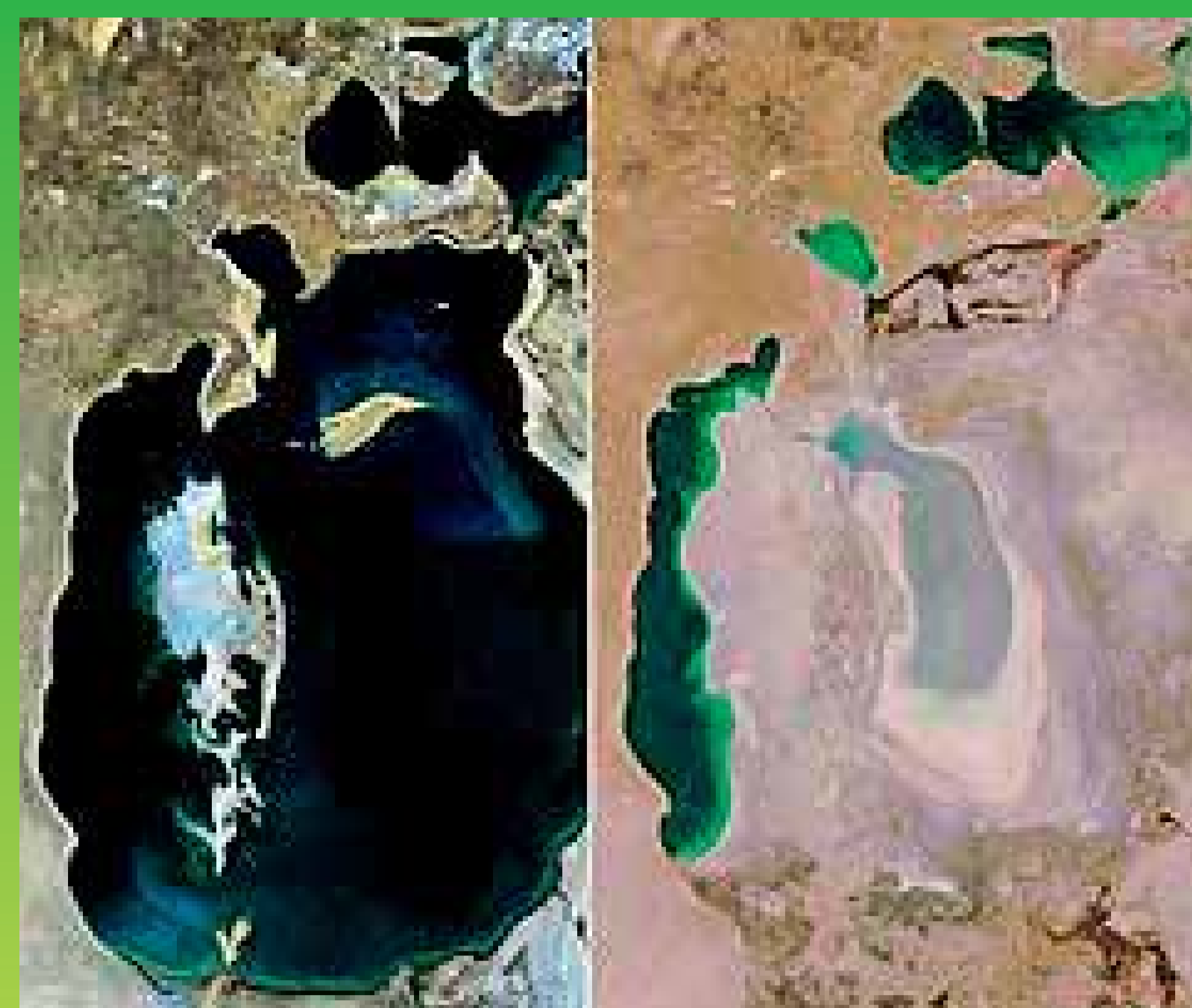
Aralské jezero v roce 1989

Udržitelný rozvoj je rozvoj, který uspokojuje potřeby současnosti bez ohrožení možnosti budoucích generací uspokojovat jejich vlastní potřeby. Strategie udržitelného rozvoje je zaměřená na prosazování harmonie mezi lidskými bytostmi a mezi lidstvem a přírodou.