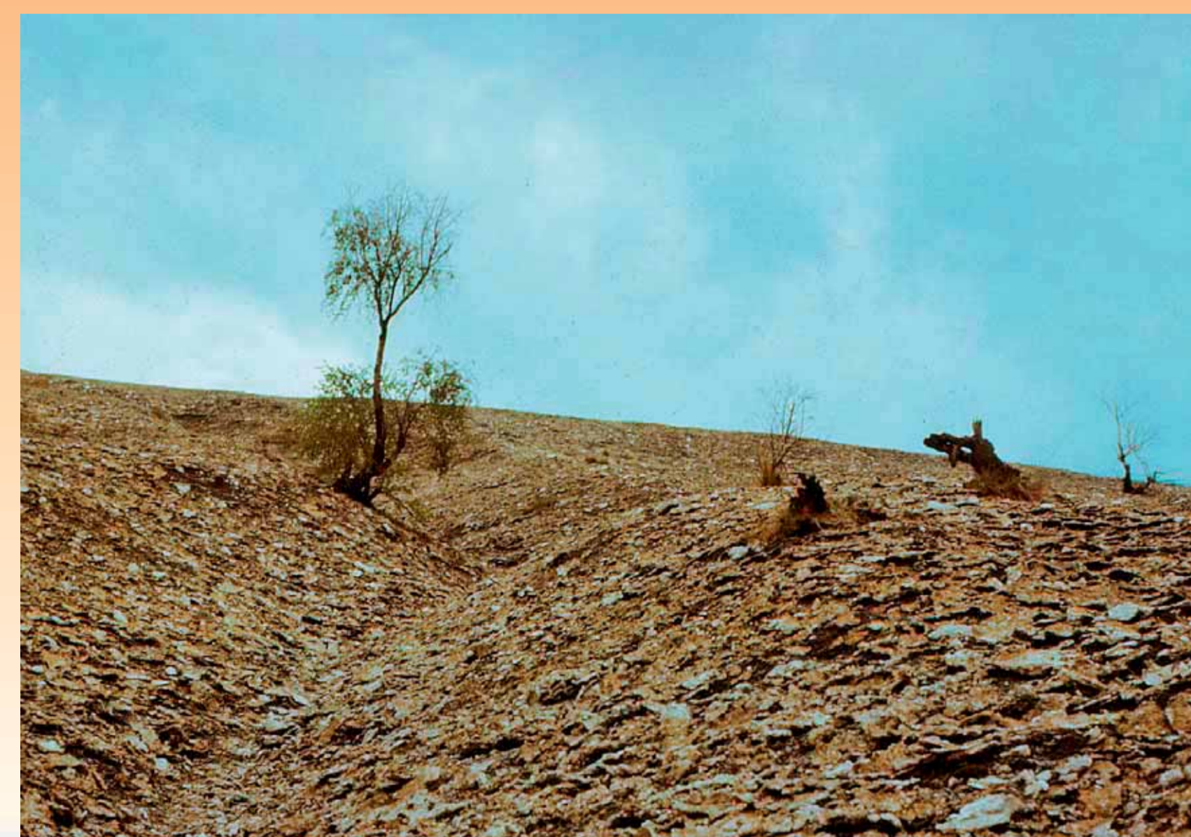
Ukázka kořistnického vztahu k přírodě (Jelšava na Slovensku).