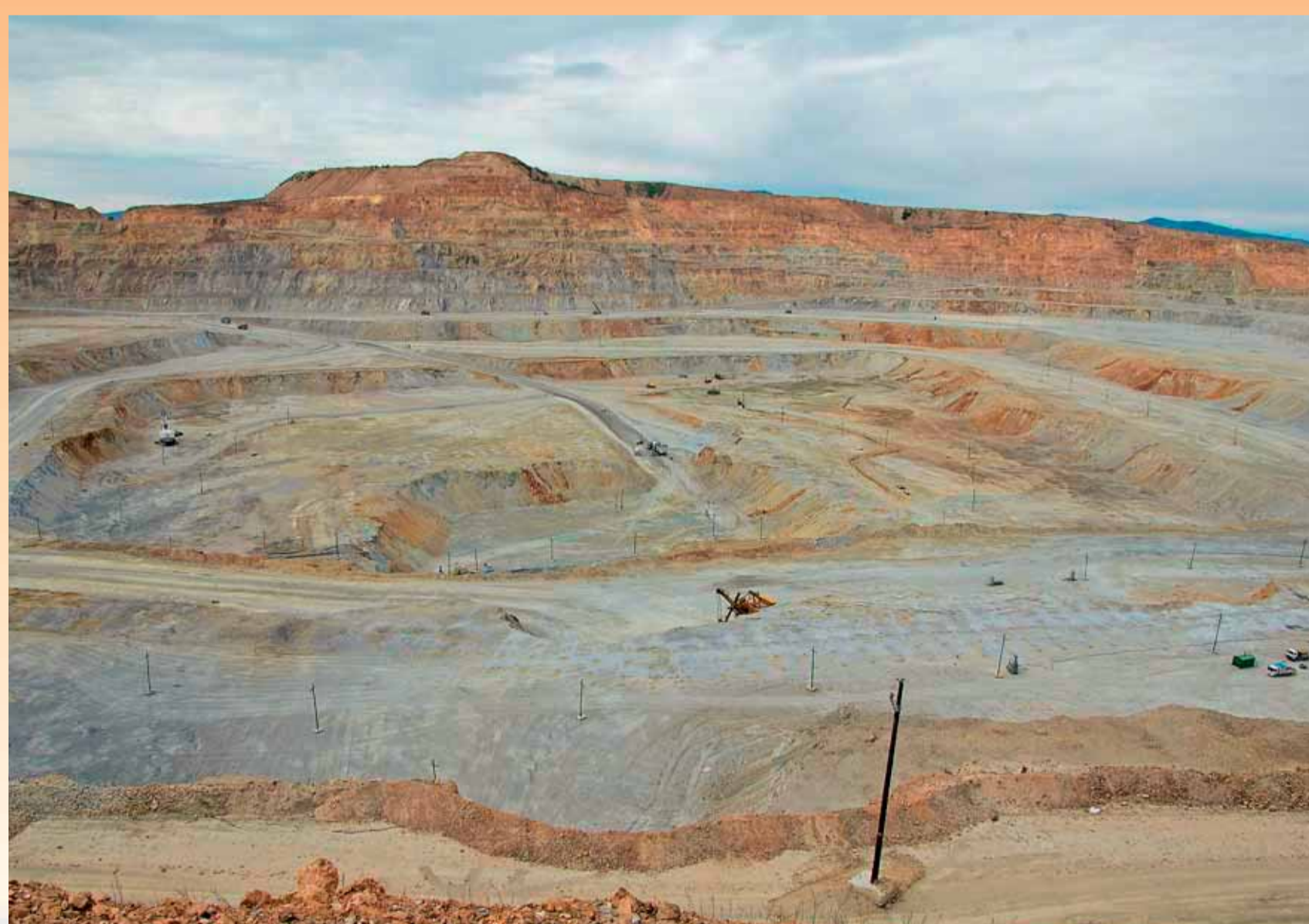
Největší naleziště měděné rudy v Asii a čtvrtý největší důl na měděnou rudu na světě. Do země díky těžbě ušlechtilých kovů proudí nemalé zahraniční investice, přitom třetina obyvatel Mongolska žije pod hranicí chudoby. (Erdenet, Mongolsko)

Nežijeme v čase posledního soudu, ale v čase zkoušky naší vlastní svobodné vůle. V čase volby mezi „dobře si žít“ a „dobře žít“. ~ Lubor Kysučan